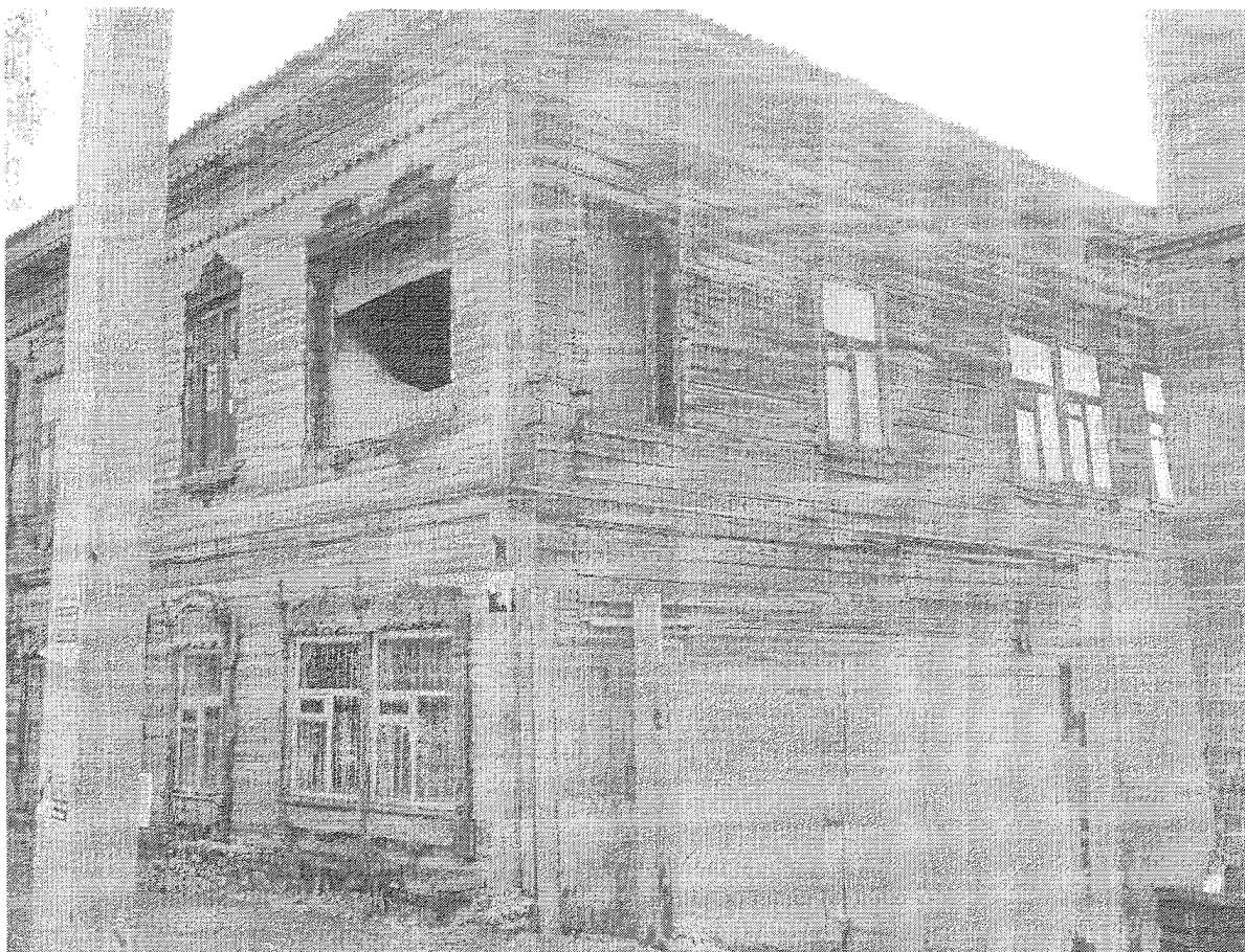
Фото 4 от 03.10.2024. Западный угол здания. Утрата наличников окон, оконных блоков.