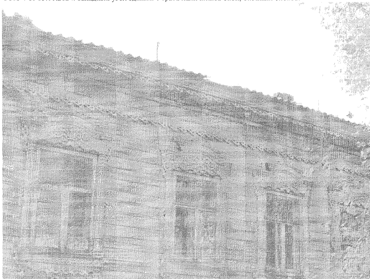
Фото 5 от 03.10.2024. Фрагмент главного фасада. Нарушение целостности покрытия кровли.