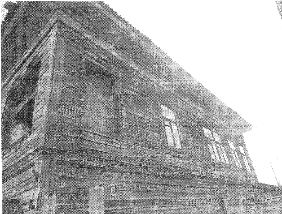
Фото 2 от 03.10.2024. Часть дворового фасада.