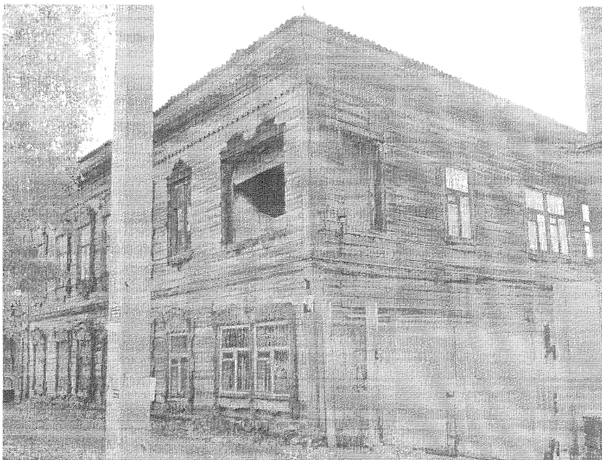
Фото 1 от 03.10.2024. Общий вид.

(наименование и адрес объекта культурного наследия)